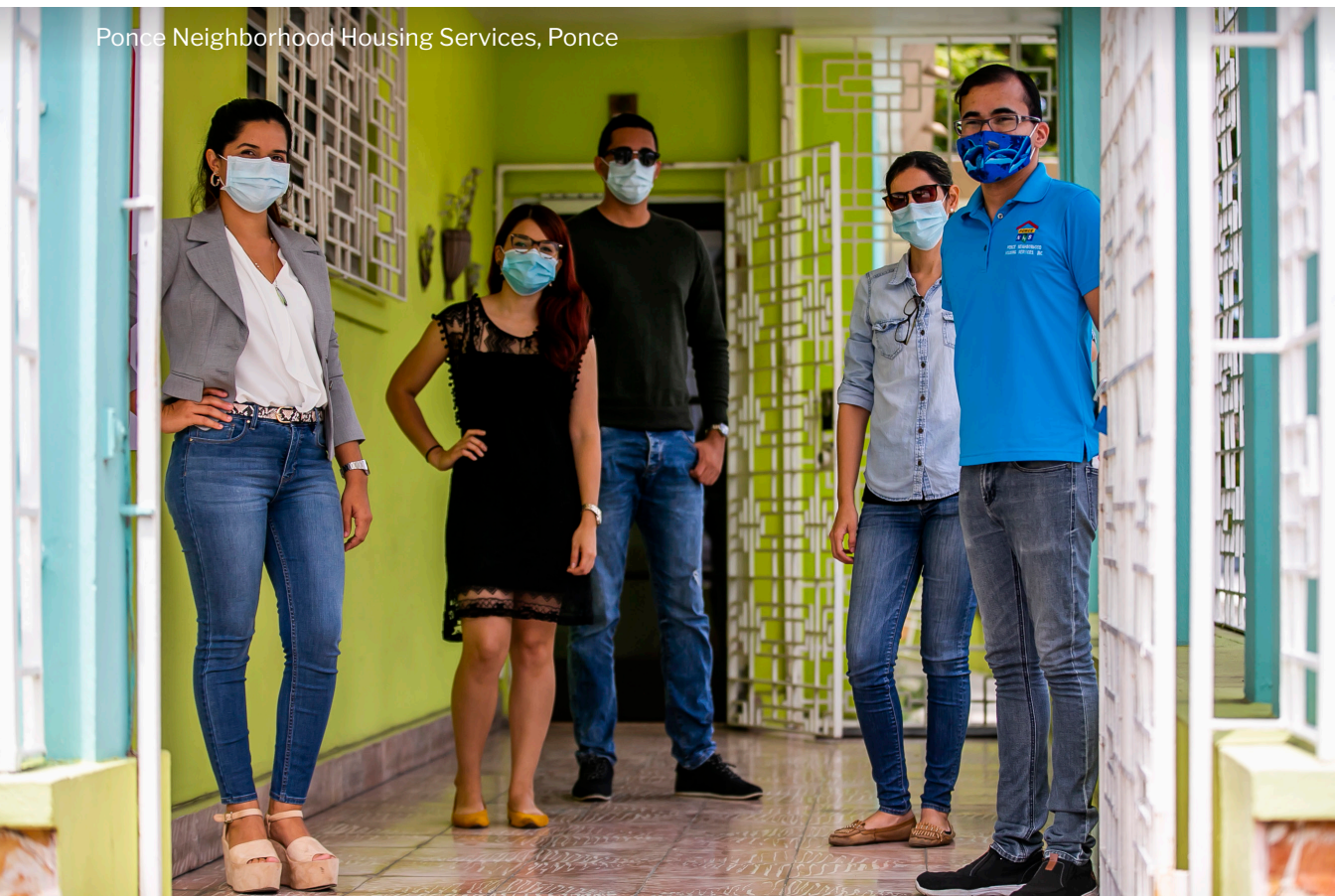
Ponce Neighborhood Housing Services, Ponce

para las OSFL en Puerto Rico a través de nuestra plataforma SINFINESPR.org. Su apoyo se ha extendido al diseño y análisis de nuestro labF3S y el patrocinio de 100 licencias de GrantStation para las OSFL participantes. Nuestra colaboración nos ha llevado a desarrollar nuevas alianzas junto a la Universidad de las Islas Vírgenes para integrar al sector sin fines de lucro de la región a nuestra plataforma de herramientas SFPR y replicar nuestro labF3S como un modelo a nivel de los EE.UU. Durante el pasado mes de julio tuvimos la oportunidad de viajar a St. Croix y St. Thomas para conversar y conocer las necesidades de estos territorios y las posibilidades de colaboración. Actualmente nos encontramos discutiendo un Memorandum of Understanding (MOU).