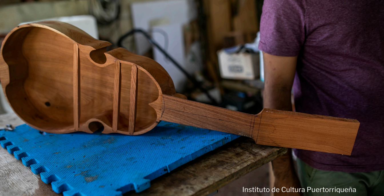
Instituto de Cultura Puertorriqueña