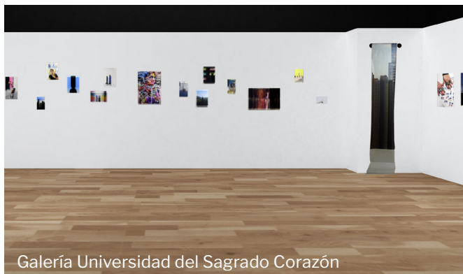
Galería Universidad del Sagrado Corazón